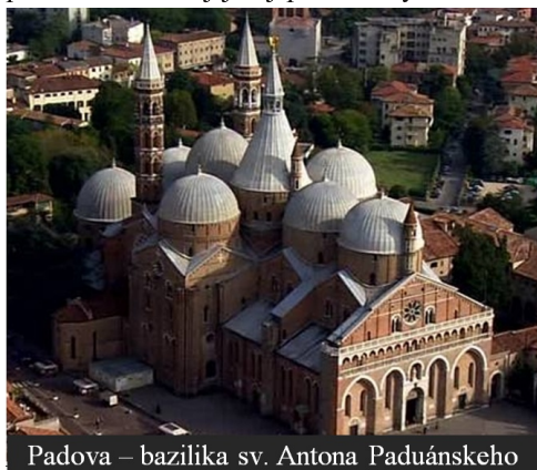
Padova – bazilika sv. Antona Paduánskeho

Bol pondelok 24. októbra ráno, asi pol piatej. Dedina bola ešte ponorená do spánku, keď sa desať pútnikov zo Suchej nad Parnou a Košolnej spolu s našim pánom farárom pridalo k ďalším pútnikom zo Smoleníc a okolia. Vybrali sme sa na dlhú púť do Večného mesta – Ríma. Popoludní sme dorazili do Padovy, kde sme mali dlhšiu prestávku. Najprv sme zamierili do baziliky sv. Justíny, kde okrem ostatkov tejto mučenice zo 4. storočia sú aj ostatky sv. Lukáša, evanjelistu, a sv. Mateja, apoštola. Padova je však mestom sv. Antona Paduánskeho, ktorý tu žil a zomrel. Preto sme zamierili do baziliky postavenej na jeho počesť a v ktorej je aj pochovaný. V tomto