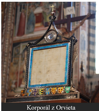
Korporál z Orvieta

chráme sme mali spoločnú sv. omšu. Potom sme mali voľný program a približne o polnoci sme sa vydali znovu na cestu – smer Assisi. Do Assisi, mesta sv. Františka, sme prišli v utorok v skorých ranných hodinách. Ako prvý sme navštívili chrám Santa Mária degli angeli, vo vnútri ktorého je malá kaplnka, ktorú opravoval sám sv. František – Porciunkula. Prešli sme sa aj okolo sochy sv. Františka, ktorá je zaujímavá tým, že vždy sú v jej blízkosti dva divoké biele holúbky, ktoré môžu voľne priletieť i odletieť, ale neustále tam dva sú. Potom sme boli v chráme sv. Kláry, kde okrem jej hrobu možno vidieť aj rúcho, ktoré nosil sv. František. Postupne sme sa uličkami mesta presunuli do chrámu sv. Františka, kde sme navštívili hrob sv. Františka a v jednej z kaplniek sme mali sv. omšu. Z Assisi sme sa už vydali do Ríma, ale ešte sme sa na chvíľu zastavili v Orvieta – meste eucharistického zázraku. V 13. storočí neďaleko Orvieta prechádzal kňaz, pôvodcom z Čiech, ktorý pochyboval o skutočnej prítomnosti Pána Ježiša v eucharistii. Počas sv. omše pri premieňaní začala z hostie kvapkať krv na korporál. Išiel za pápežom, ktorý bol vtedy v Orvieta, a ten po preskúmaní potvrdil a vyhlásil, že ide o eucharistický zázrak. Odvtedy sa korporál s kvapkami krvi uchováva ako relikvia v katedrále v Orvieta, ktorú sme navštívili aj my. (Pokračovanie nabuduce.)